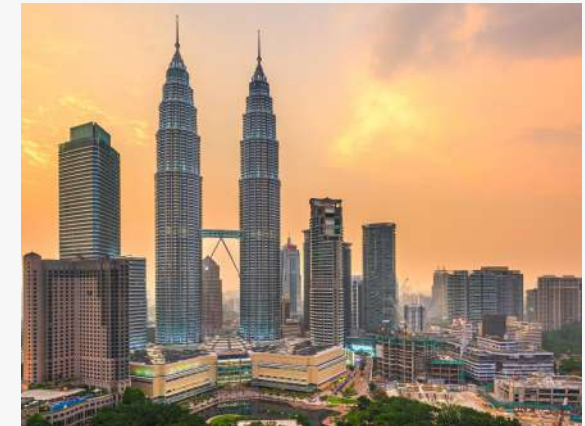
PARTICIPATION SALON INTERNATIONAUX

Les PME/PMI reçoivent une Accélération sur les bases du commerce international ainsi qu'un Accompagnement personnalisé du Cabinet Carrée et de ses différents experts.