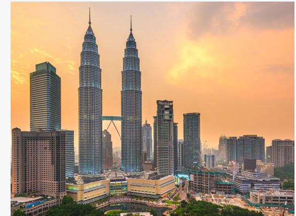
PARTICIPATION SALON INTERNATIONAUX

Les PME/PMI reçoivent une Accélération sur les bases du commerce international ainsi qu'un Accompagnement personnalisé du Cabinet Carrée et de ses différents experts.