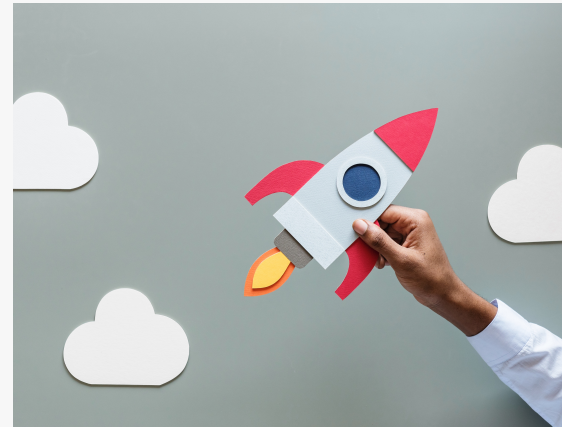
ACCÉLÉRATION DE CROISSANCE

Les PME/PMI reçoivent une Accélération sur les bases du commerce international ainsi qu'un Accompagnement personnalisé du Cabinet Carrée et de ses différents experts.